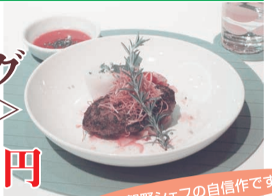
佐賀野シェフの自信作です