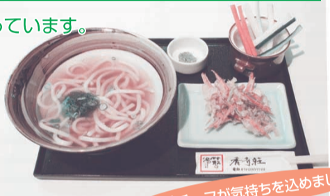
小林チーフが気持ちを込めました